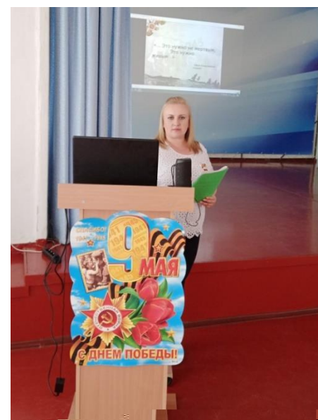
На фото мероприятия в актовом зале лицея: «23 февраля» и «9 мая»