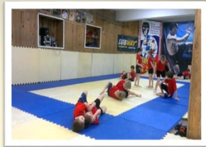
ОСЕ и ЦСПВ «ВИТЯЗЬ»