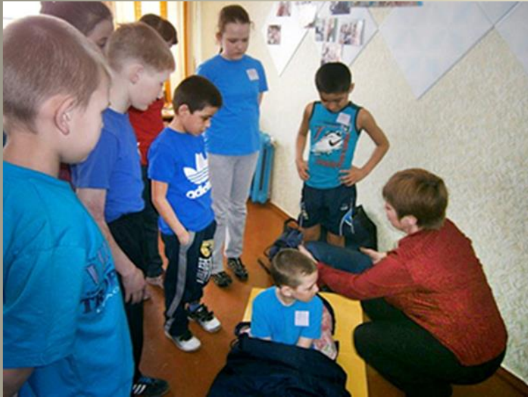
МБУ ДО «СТАНЦИЯ ТУРИЗМА И ЭКСКУРСИЙ»