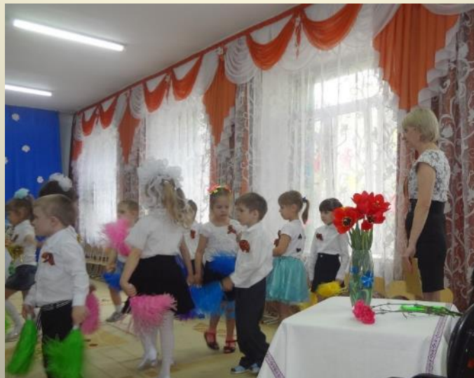
МБДОУ «Детский сад № 19 «Рябинка»